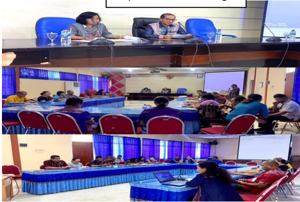
Rapat Evaluasi Stunting