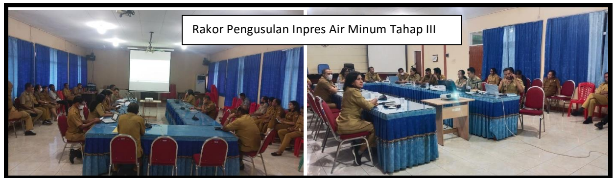
Rakor Pengusulan Inpres Air Minum Tahap III