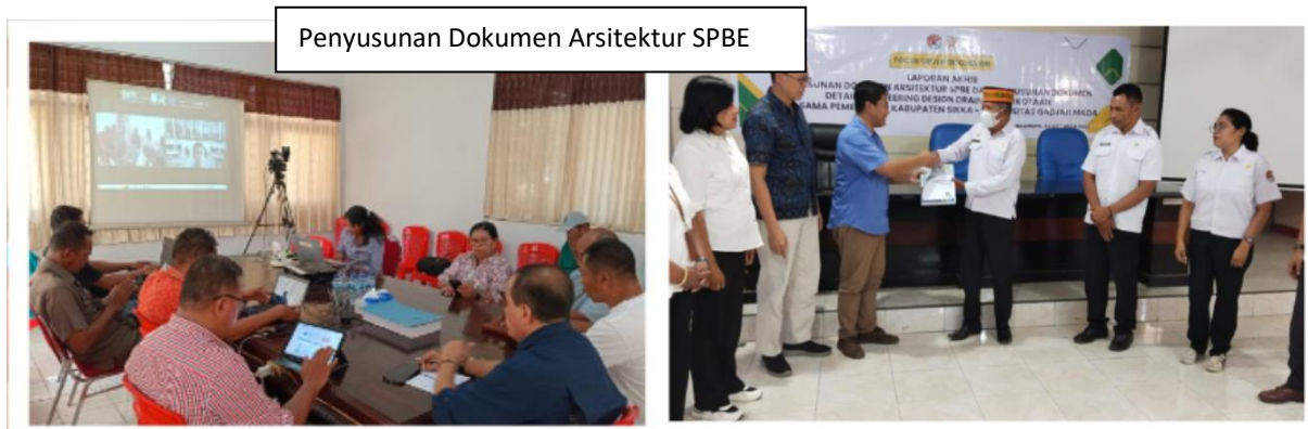
Penyusunan Dokumen Arsitektur SPBE