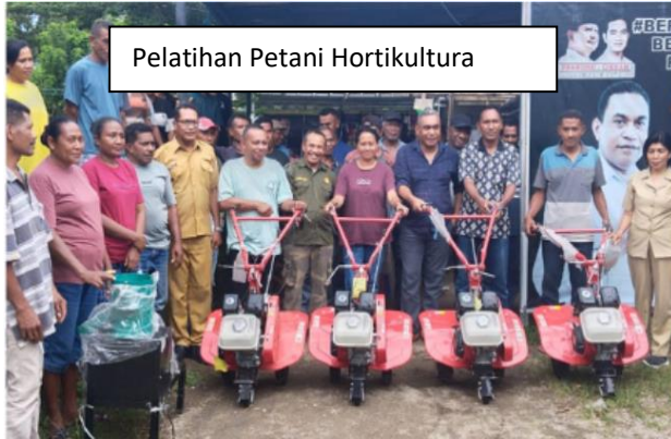
Pelatihan Petani Hortikultura