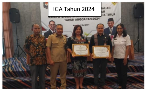
IGA Tahun 2024