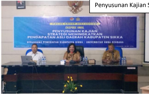
Penyusunan Kajian Strategis PAD