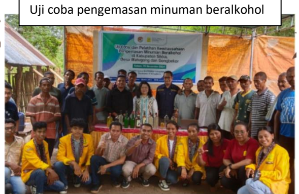
Uji coba pengemasan minuman beralkohol