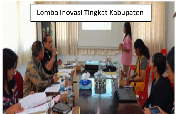
Lomba Inovasi Tingkat Kabupaten