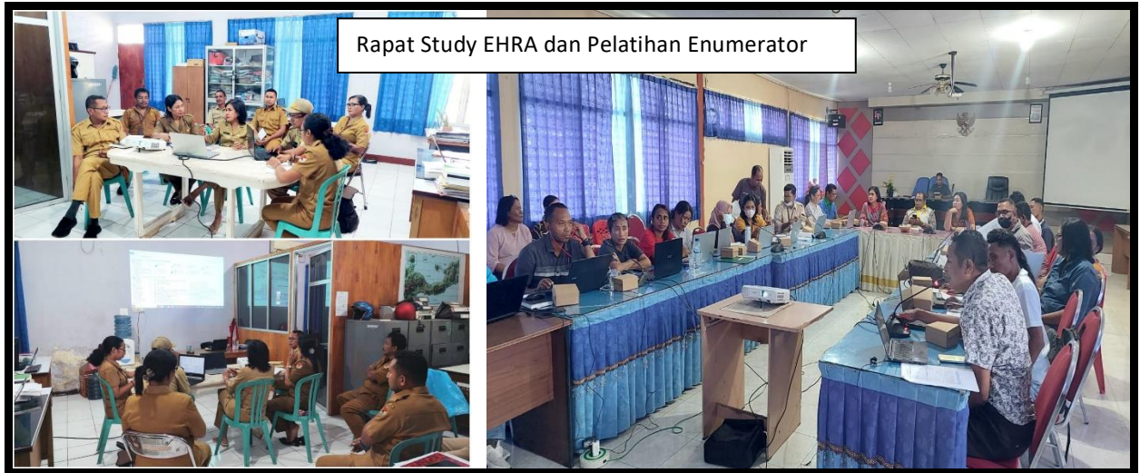
Rapat Study EHRA dan Pelatihan Enumerator