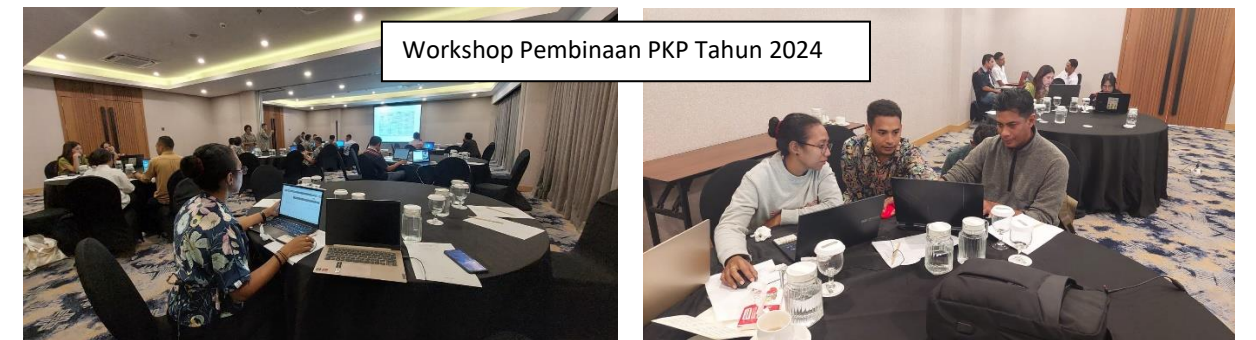
Workshop Pembinaan PKP Tahun 2024