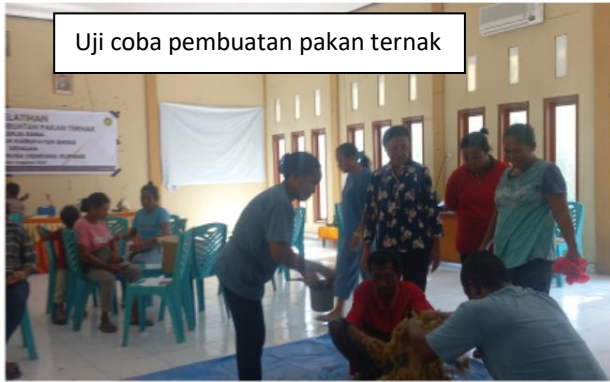
Uji coba pembuatan pakan ternak