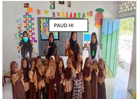
Verifikasi Data P3KE